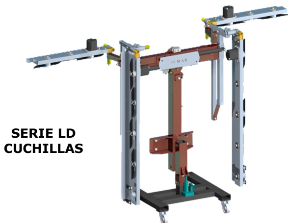
SERIE LD CUCHILLAS